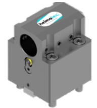
Bohrstangenhalter (8 240 ...)