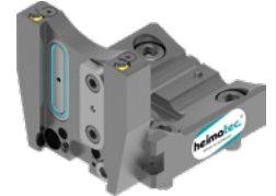
Abstechhalter (8 320 ...)