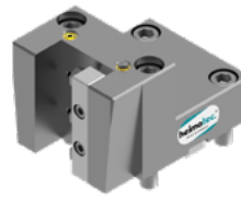
Drehstahlhalter (8 224 14 007)