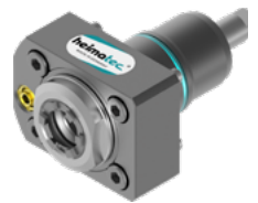
Axial-Bohr- und Fräskopf (8 010 ...)