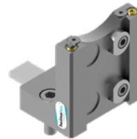
Abstechhalter (8 224 ...)