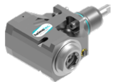
Winkel-Bohr- und Fräskopf (8 030 ...)