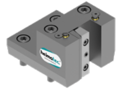
Drehstahlhalter mit Keilklemmung (8 224 14 024)