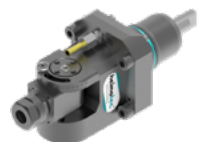
Schwenkkopf (8 040 ...)