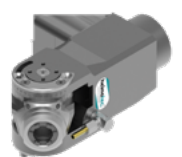
Schwenkkopf (8 043 ...)