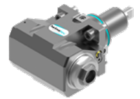
Winkel-Bohr- und Fräskopf (8 030 ...)