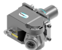
Schwenkkopf (8 043 ...)