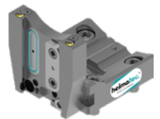
Abstechhalter (8 320 ...)