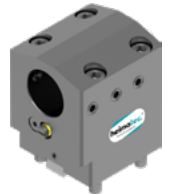
Bohrstangenhalter (8 240 ...)