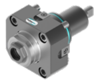
Axial-Bohr- und Fräskopf (8 010 ...)