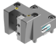
Kombi-Drehstahlhalter (8 224 15 006)