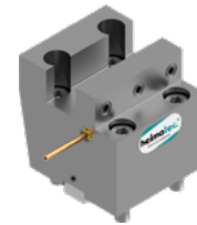
Kombi-Plandrehstahl- halter (8 244 ...)