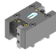
Doppel-Drehstahlhalter (8 251 ...)