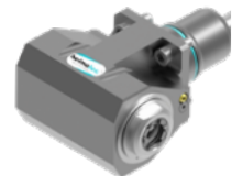
Winkel-Bohr- und Fräskopf - DOPPELT (8 039 ...)