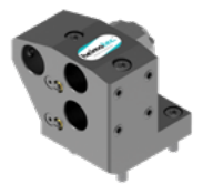
Mehrfach-Bohrstangen- halter (8 253 07 008)