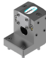
Mehrfach-Bohrstangen- halter (8 253 07 048)