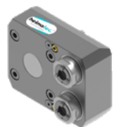
Mehrspindelbohrkopf (8 050 ...)