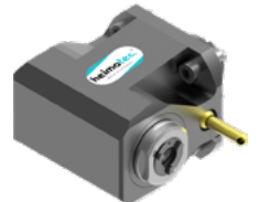
Winkel-Bohr- und Fräskopf (8 030 ...)