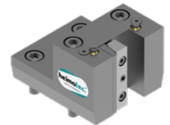
Drehstahlhalter mit Keilklemmung (8 224 14 024)