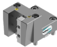
Drehstahlhalter (8 224 14 007)