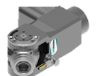
Schwenkkopf (8 043 ...)