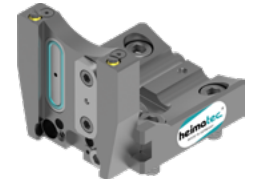
Abstechhalter (8 320 ...)