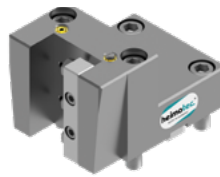
2 x Vkt. 25