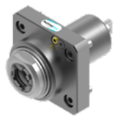
Axial-Bohr- und Fräskopf (8 010 ...)