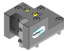
Kombi-Drehstahlhalter (8 224 ...)