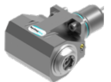
Winkel-Bohr- und Fräskopf- DOPPELT (8 039 ...)