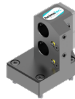
Doppel-Bohrstangen- halter (8 253 07 000)