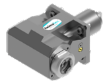
Winkel-Bohr- und Fräskopf (8 030 ...)