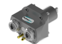
Mehrspindelbohrkopf (8 050 ...)