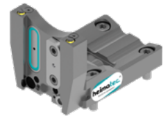
Abstechhalter (8 320 ...)