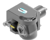
Schwenkkopf (8 043 ...)