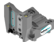
Abstechhalter (8 320 ...)