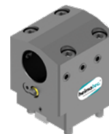
Bohrstangenhalter (8 240 ...)