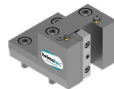
Kombi-Drehstahlhalter mit Keilklemmung (8 224 15 053)