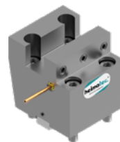
Kombi-Plandrehstahl- halter (8 244 ...)