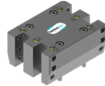
4 x Vkt. 20