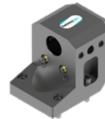
Bohrstangenhalter (8 240 ...)