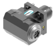
Winkel-Bohr- und Fräskopf (8 030 ...)