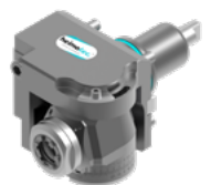
Schwenkkopf (8 043 ...)