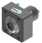
Axial-Bohr- und Fräskopf (8 010 ...)