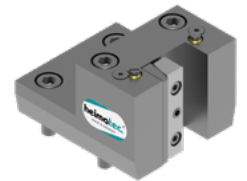
Kombi-Drehstahlhalter mit Keilklemmung (8 224 15 053)