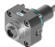
Axial-Bohr- und Fräskopf (8 010 ...)