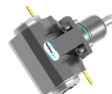
Winkel-Bohr- und Fräskopf - DOPPELT (8 039 ...)