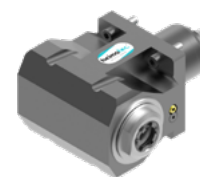
Winkel-Bohr- und Fräskopf (8 030 ...)